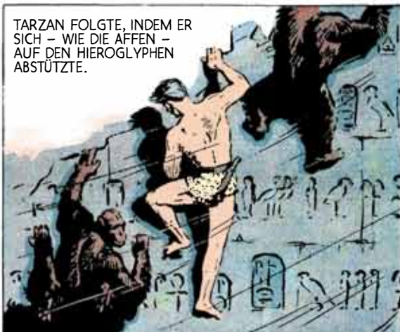
TARZAN FOLGTE, INDEM ER SICH - WIE DIE AFFEN - AUF DEN HIEROGLYPHEN ABSTÜTZTE.