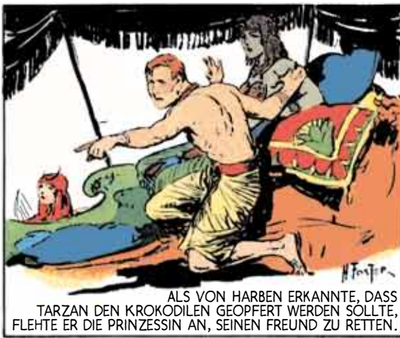
ALS VON HARBEN ERKANNTTE, DASS TARZAN DEN KROKODILEN GEOPFERT WERDEN SOLLTE, FLEHTE ER DIE PRINZESSIN AN, SEINEN FREUND ZU RETTEN.