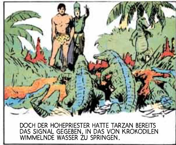
DOCH DER HOHEPRIESTER HATTE TARZAN BEREITS DAS SIGNAL GEGEBEN, IN DAS VON KROKODILEN WIMMELNDE WASSER ZU SPRINGEN.