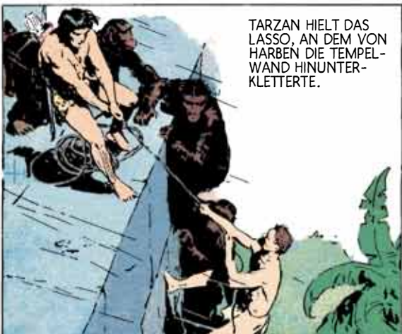
TARZAN HIELT DAS LASSO, AN DEM VON HARBEN DIE TEMPELWAND HINUNTERKLETTERTE.