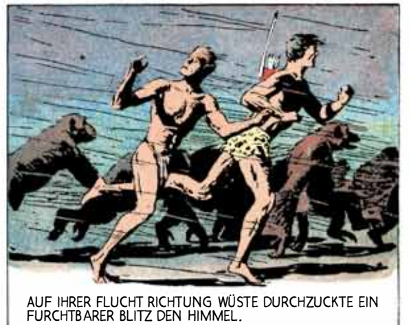
AUF IHRER FLUCHT RICHTUNG WÜSTE DURCHZUCKTE EIN FURCHTBARER BLITZ DEN HIMMEL.