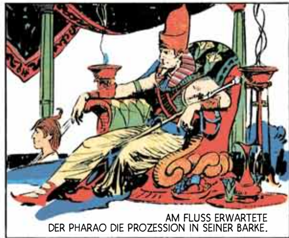
AM FLUSS ERWARTETE DER PHARAO DIE PROZESSION IN SEINER BARKE.