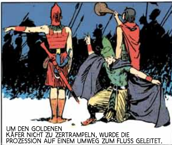
UM DEN GOLDENEN KÄFER NICHT ZU ZERTRAMPeln, WURDE DIE PROZESSION AUF EINEM UMWEG ZUM FLUSS GELEITET.