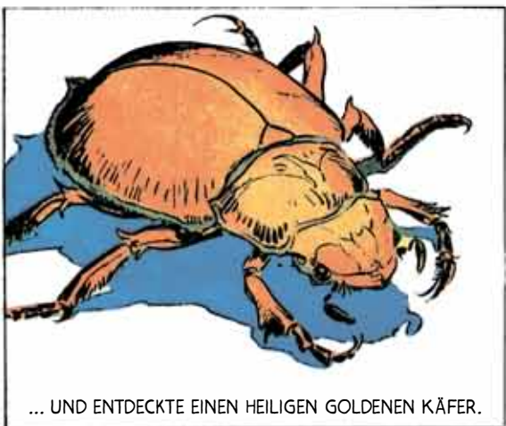
... UND ENTDECKTE EINEN HEILIGEN GOLDENEN KÄFER.