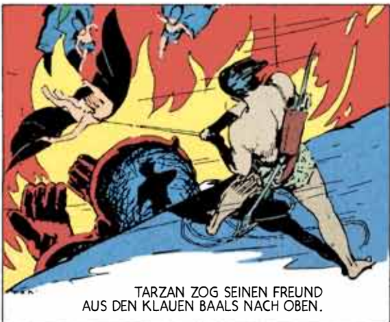
TARZAN ZOG SEINEN FREUND AUS DEN KLAUEN BAALS NACH OBEN.