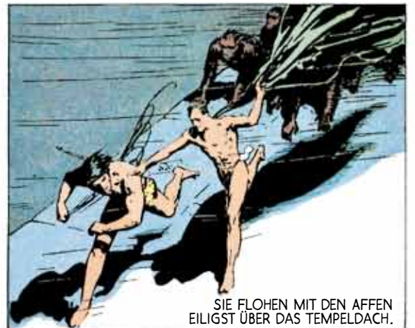
SIE FLOHEN MIT DEN AFFEN EILIGST ÜBER DAS TEMPELDACH.