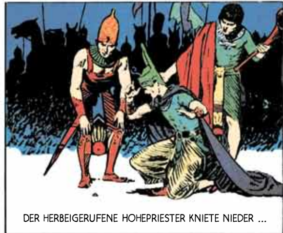
DER HERBEIGERUFENE HOHEPRIESTER KNIETE NIEDER ...