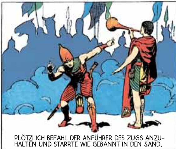
PLÖTZLICH BEFAHL DER ANFÜHRER DES ZUGS ANZUHALTEN UND STARRTE WIE GEBANNT IN DEN SAND.