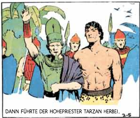
DANN FÜHRTE DER HOHEPRIESTER TARZAN HERBEI.