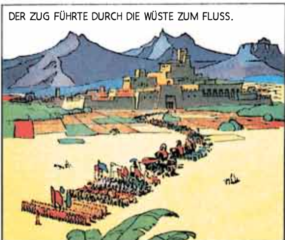
DER ZUG FÜHRTE DURCH DIE WÜSTE ZUM FLUSS.