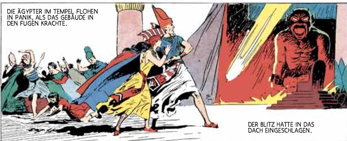
DIE ÄGYPTER IM TEMPEL FLOHEN IN PANIK, ALS DAS GEBÄUDE IN DEN FUGEN KRACHTE.