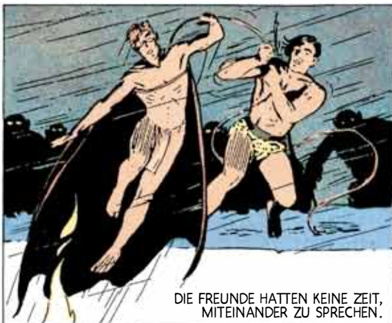
DIE FREUNDE HATTEN KEINE ZEIT, MITEINANDER ZU SPRECHEN.