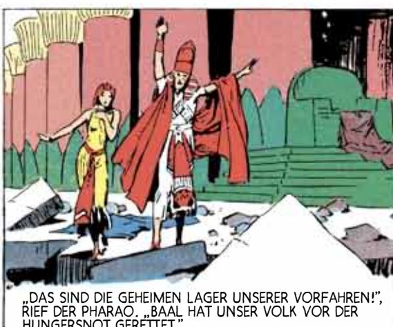
„DAS SIND DIE GEHEIMEN LAGER UNSERER VORFAHREN!“, RIEF DER PHARAO. „BAAL HAT UNSER VOLK VOR DER HUNGRERSNOT GERETTET.“