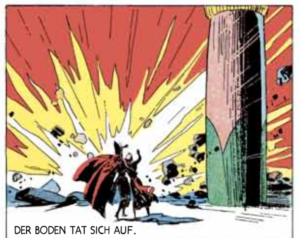
DER BODEN TAT SICH AUF.