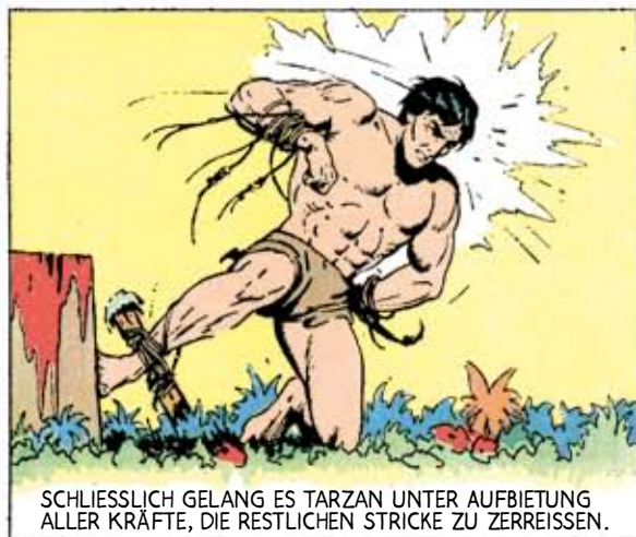
SCHLIESSLICH GELANG ES TARZAN UNTER AUFBIETUNG ALLER KRÄFTE, DIE RESTLICHEN STRICKE ZU ZERREISSEN.