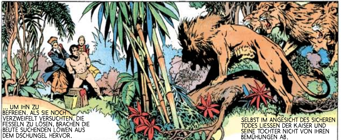
... UM IHN ZU BEFREIEN. ALS SIE NOCH VERZWEIFELT VERSUCHTEN, DIE FESSELN ZU LÖSEN, BRACHEN DIE BEUTE SUCHENDEN LÖWEN AUS DEM Dschungel HERVOR.