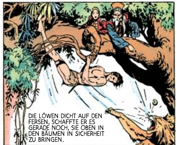
DIE LÖWEN DICHT AUF DEN FERSEN, SCHAFFTE ER ES GERADE NOCH, SIE OBEN IN DEN BÄUMEN IN SICHERHEIT ZU BRINGEN.