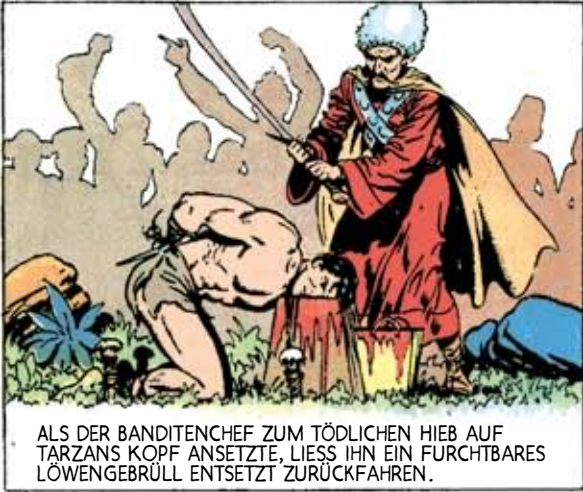
ALS DER BANDITENCHEF ZUM TÖDLICHEN HIEB AUF TARZANS KOPF ANSETZTE, LIESS IHN EIN FURCHTBARES LÖWENGEBRÜLL ENTSETZT ZURÜCKFAHREN.