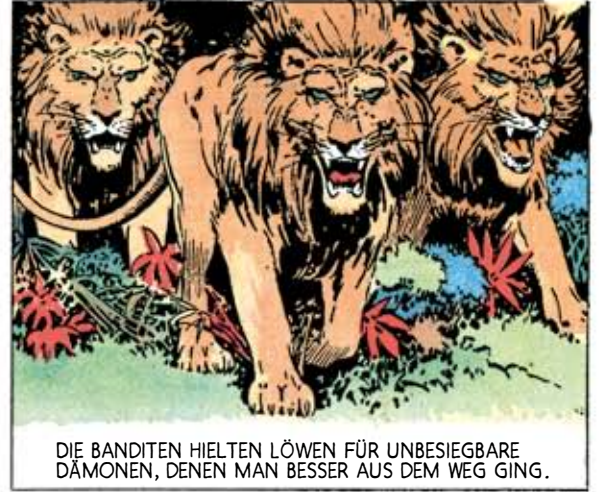
DIE BANDITEN HIELTEN LÖWEN FÜR UNBESIEGBARE DÄMONEN, DENEN MAN BESSER AUS DEM WEG GING.