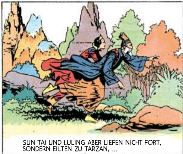
SUN TAI UND LULING ABER LIEFEN NICHT FORT, SONDERN EILTEN ZU TARZAN, ...