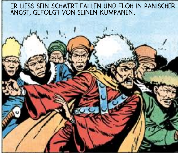
ER LIESS SEIN SCHWERT FALLEN UND FLOH IN PANISCHER ANGST, GEFOLGT VON SEINEN KUMPANEN.